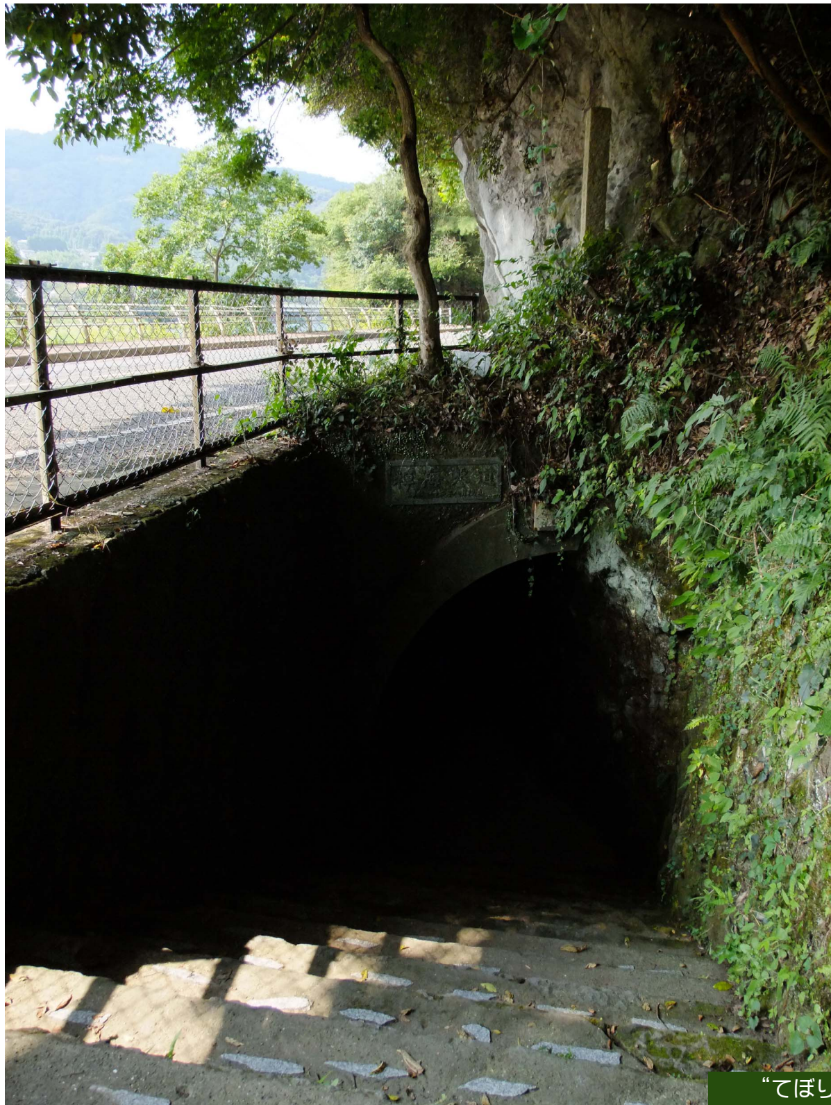
“てぼりの隧道” 入り口（第五洞）