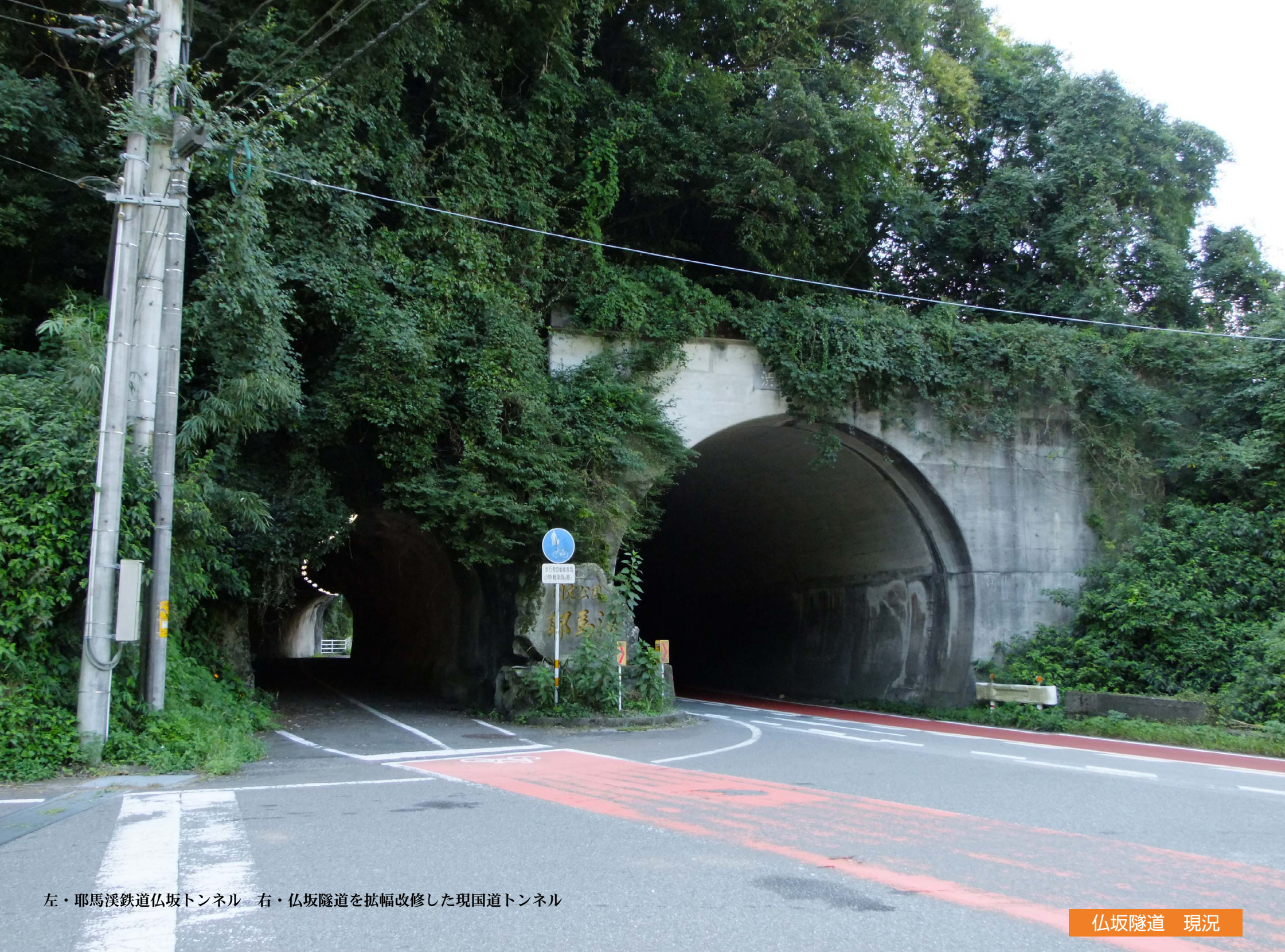
左・耶馬溪鉄道仏坂トンネル 右・仏坂隧道を拡幅改修した現国道トンネル