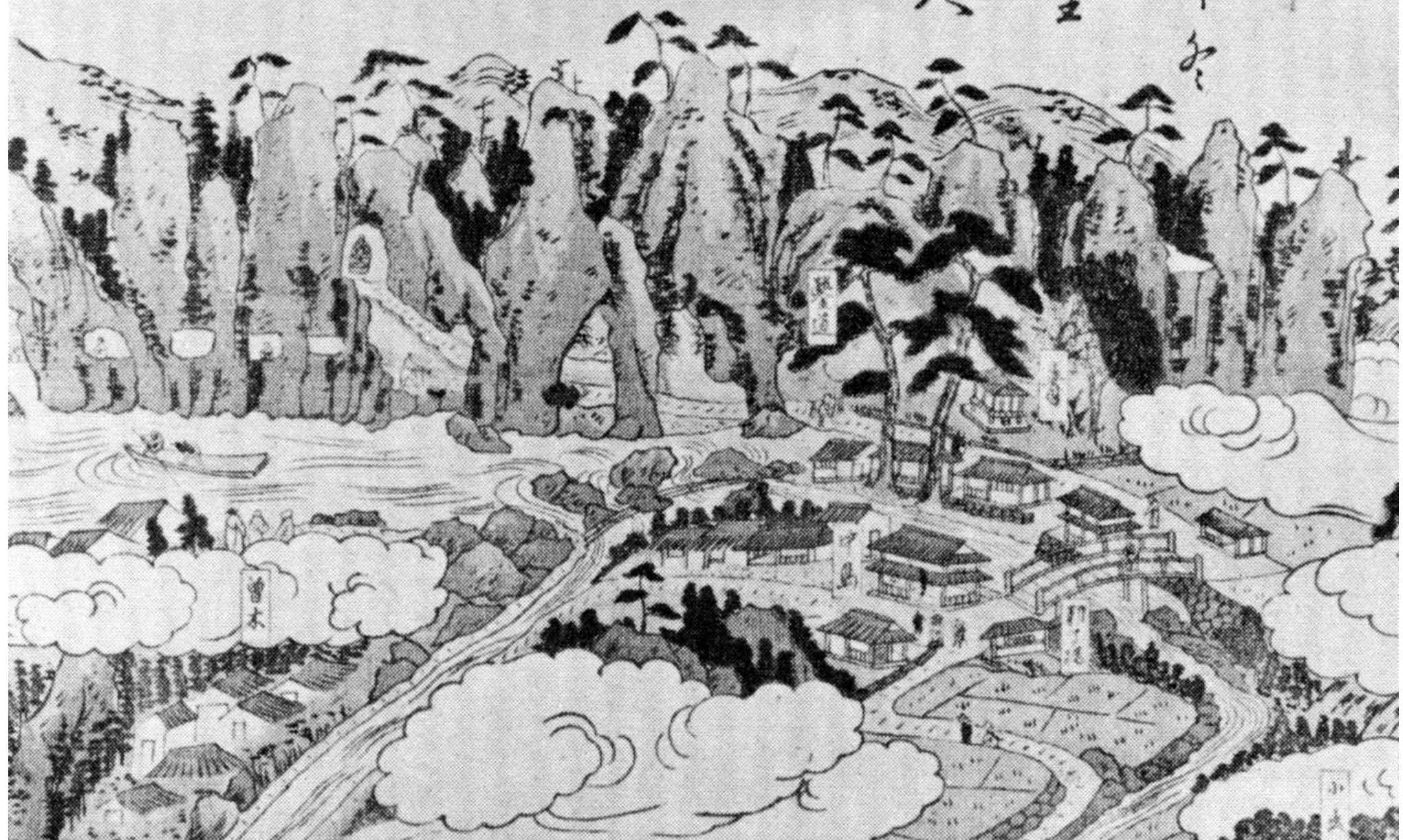
常足道人『豊前之國羅漢寺真景』(部分・嶼水園発行絵葉書より引用)