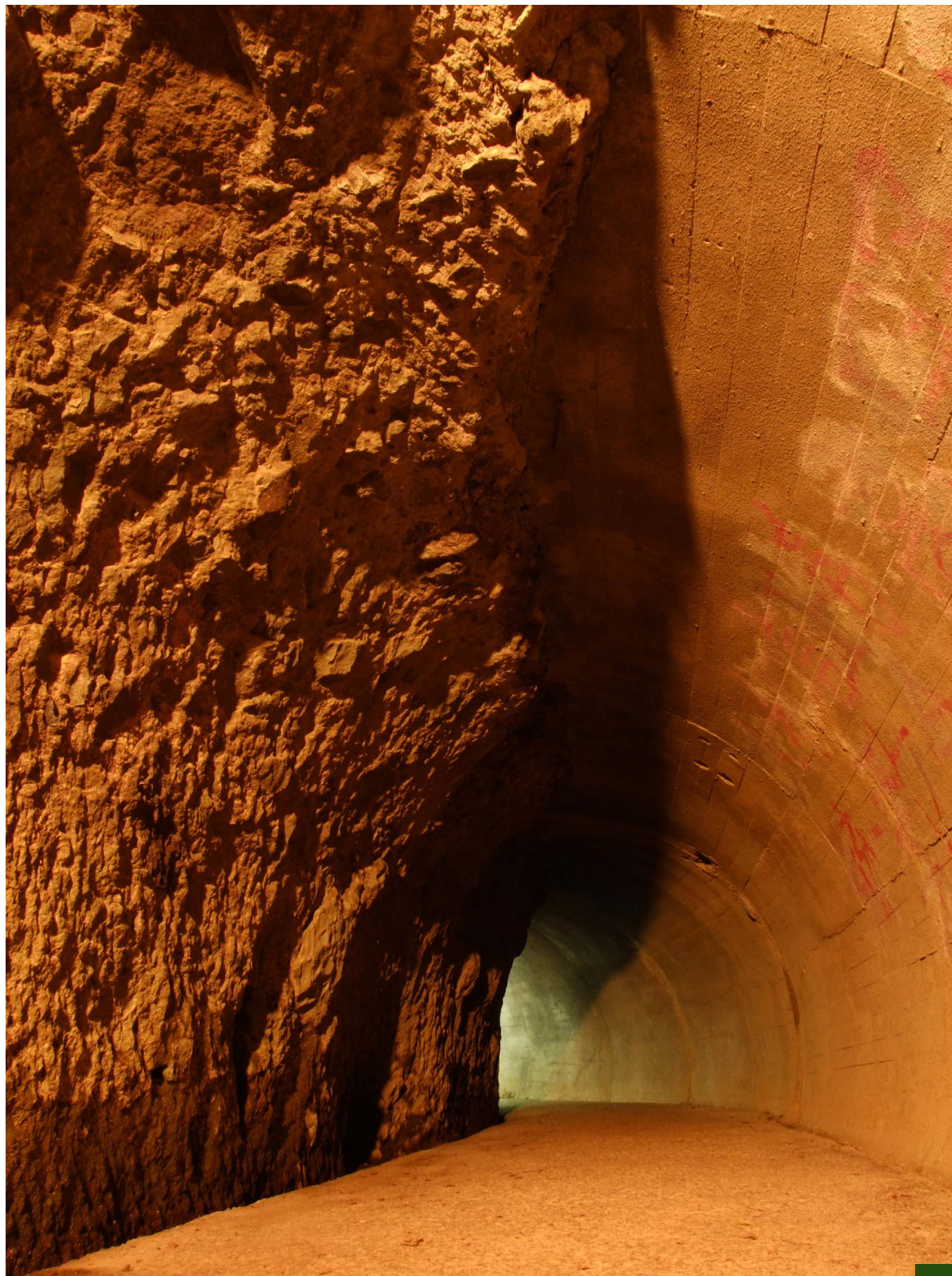
“てぼりの隧道”内部