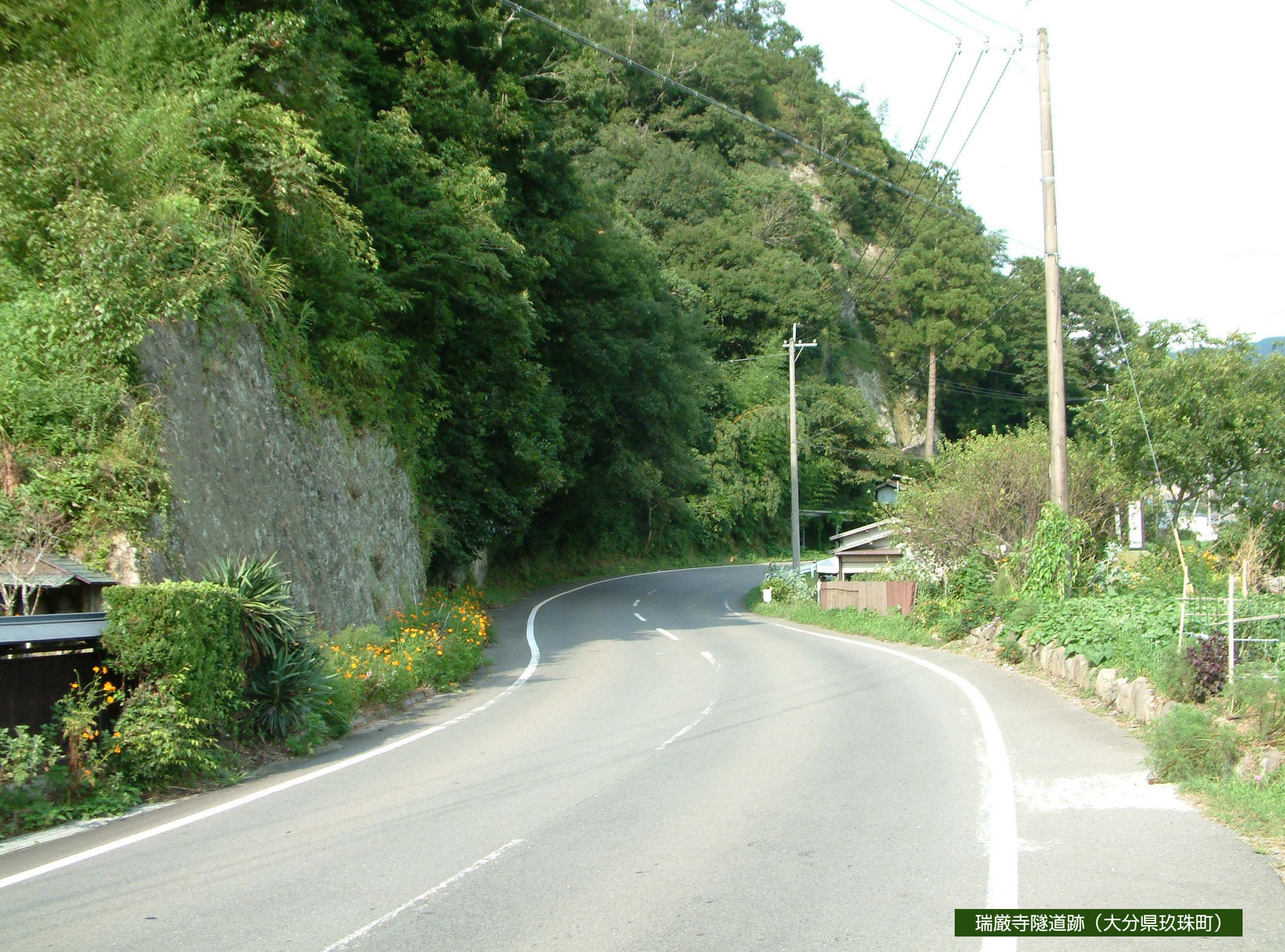
瑞巖寺隧道跡（大分県玖珠町）