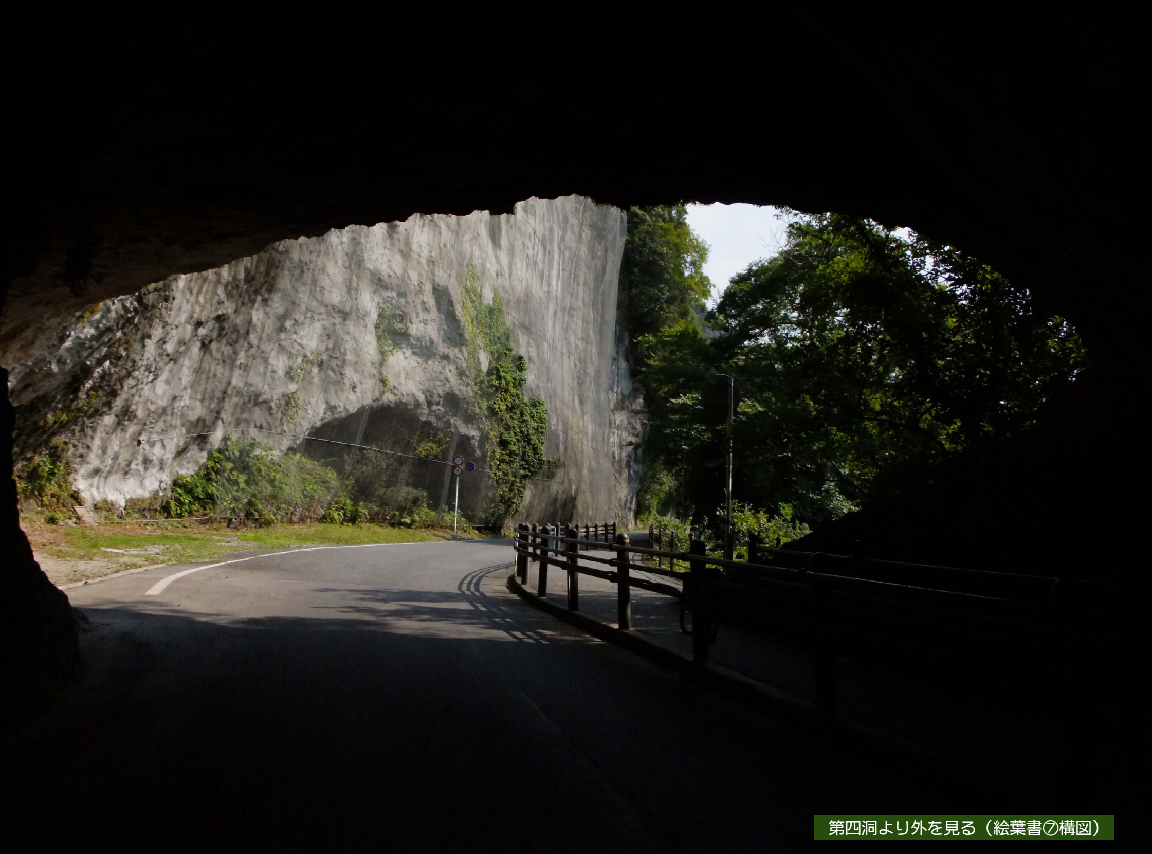
第四洞より外を見る（絵葉書⑦構図）