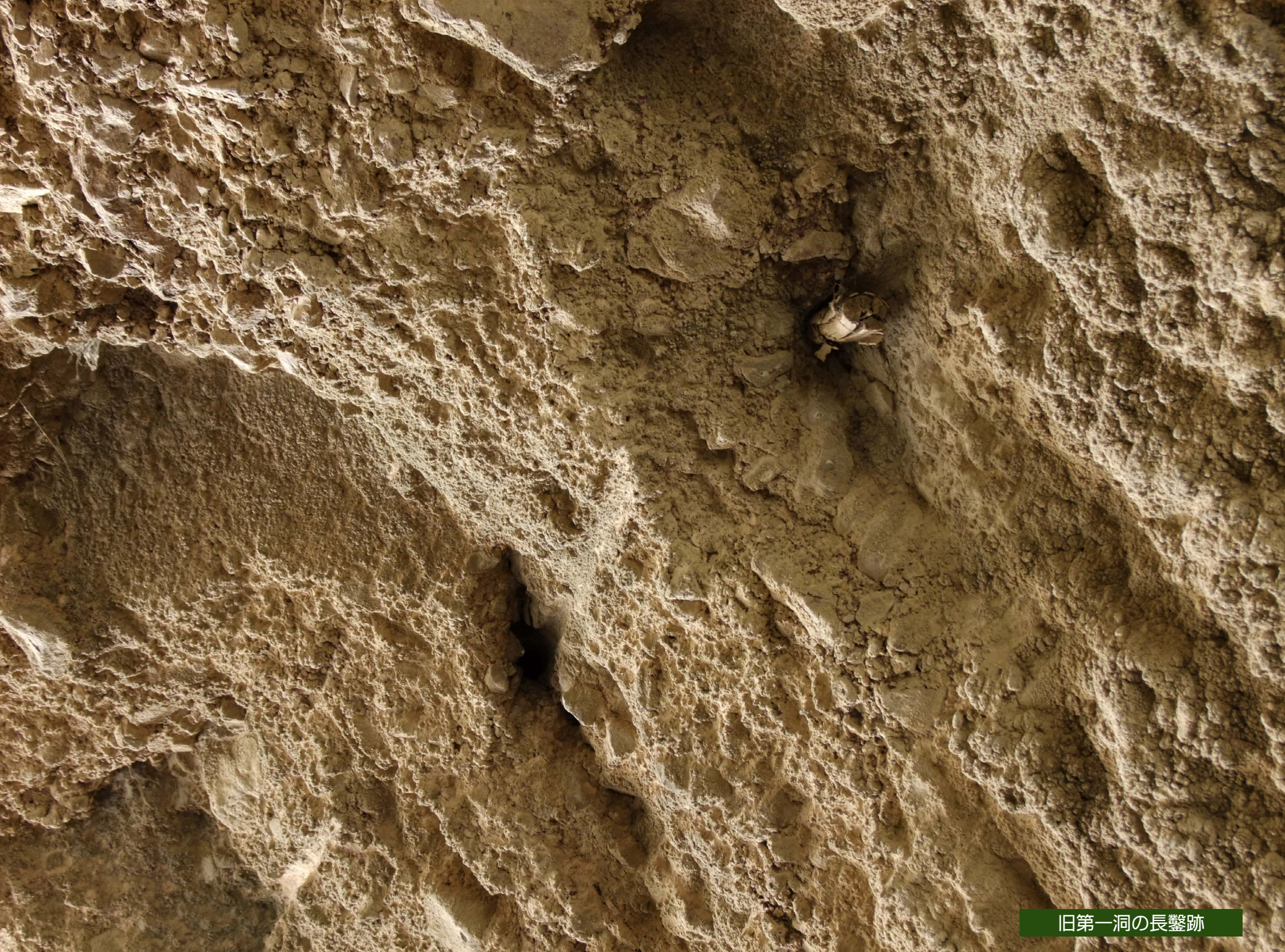
旧第一洞の長鑿跡