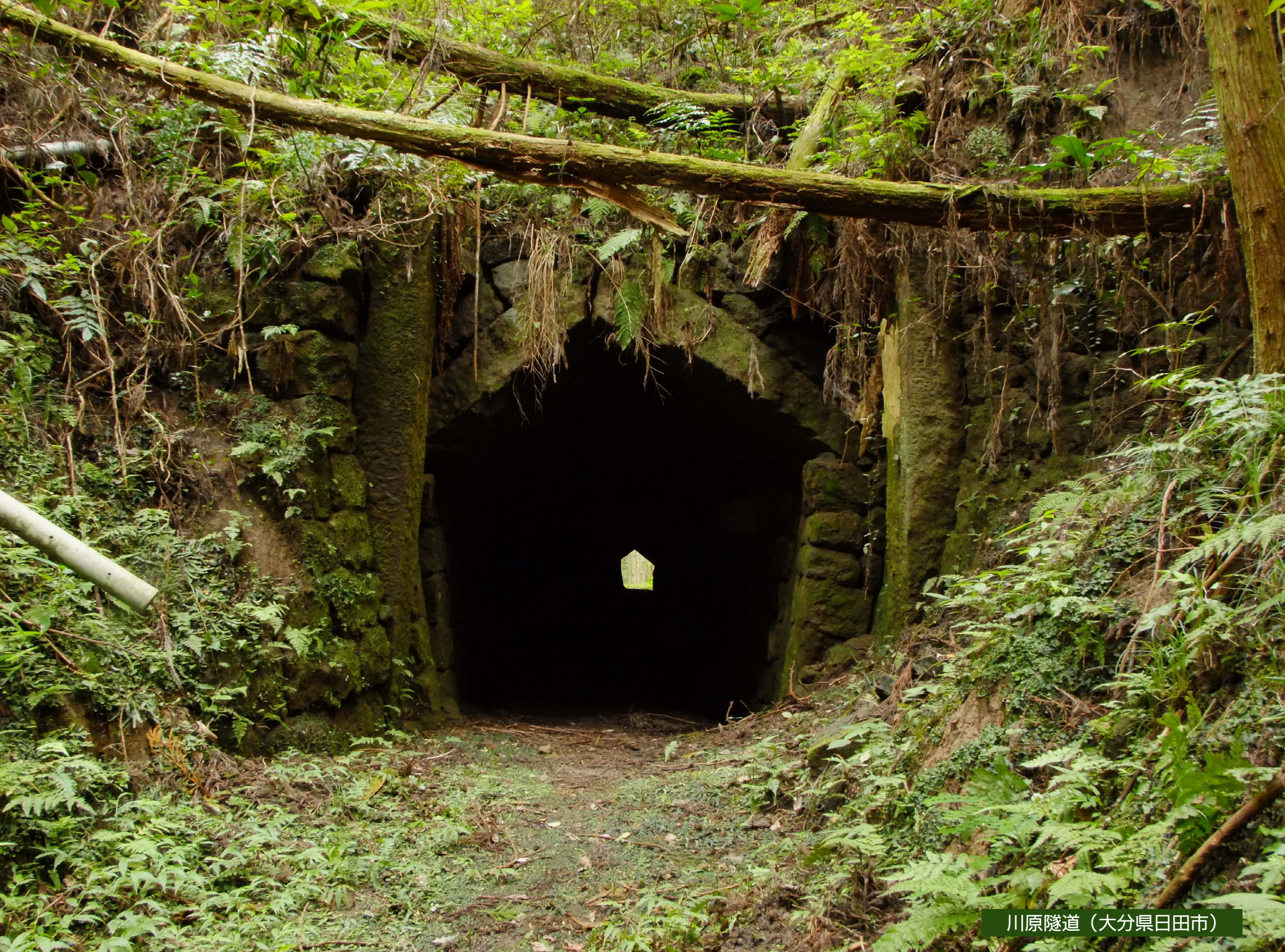
川原隧道 (大分県日田市)