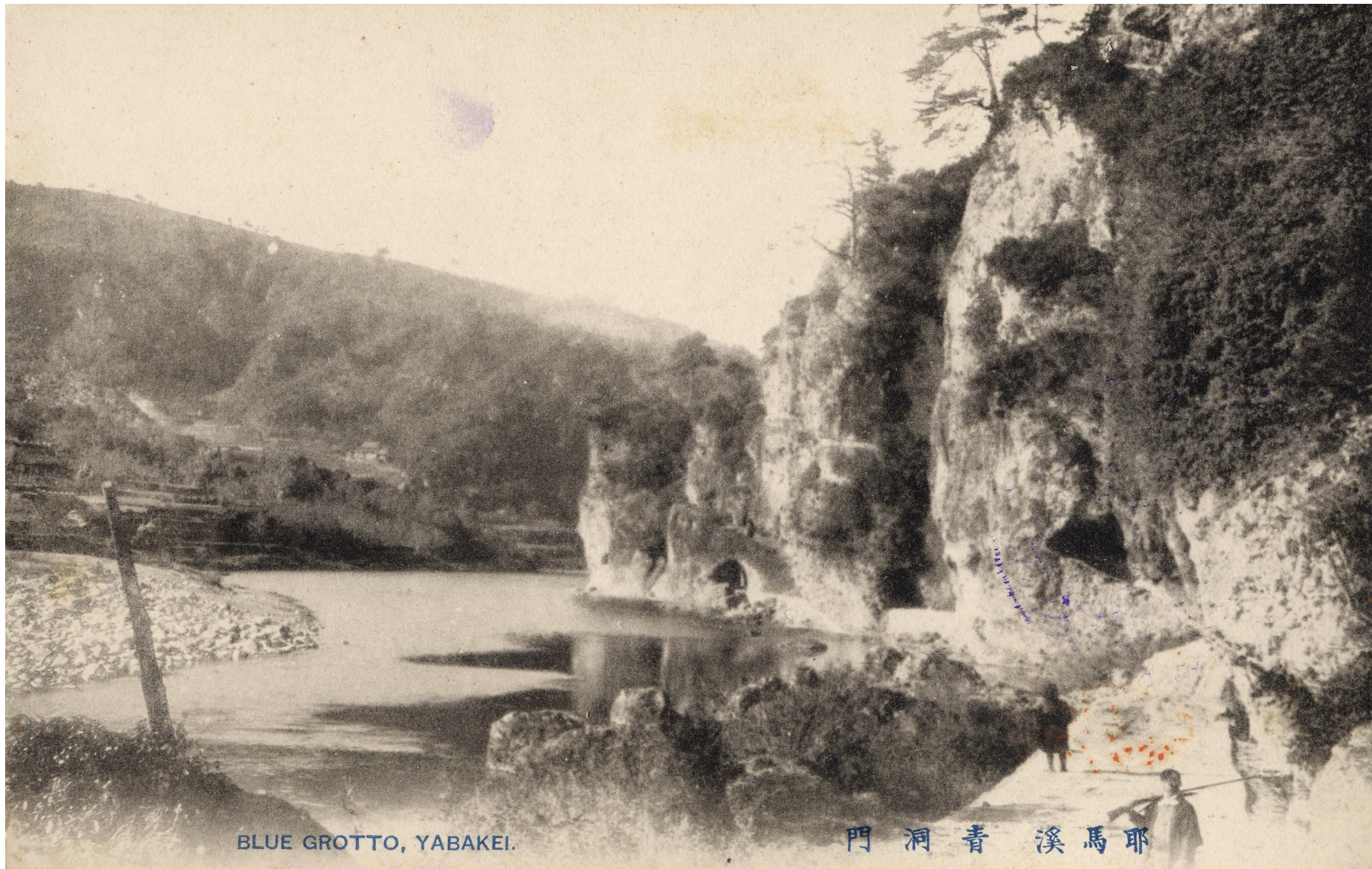
BLUE GROTTTO, YABAKEI.