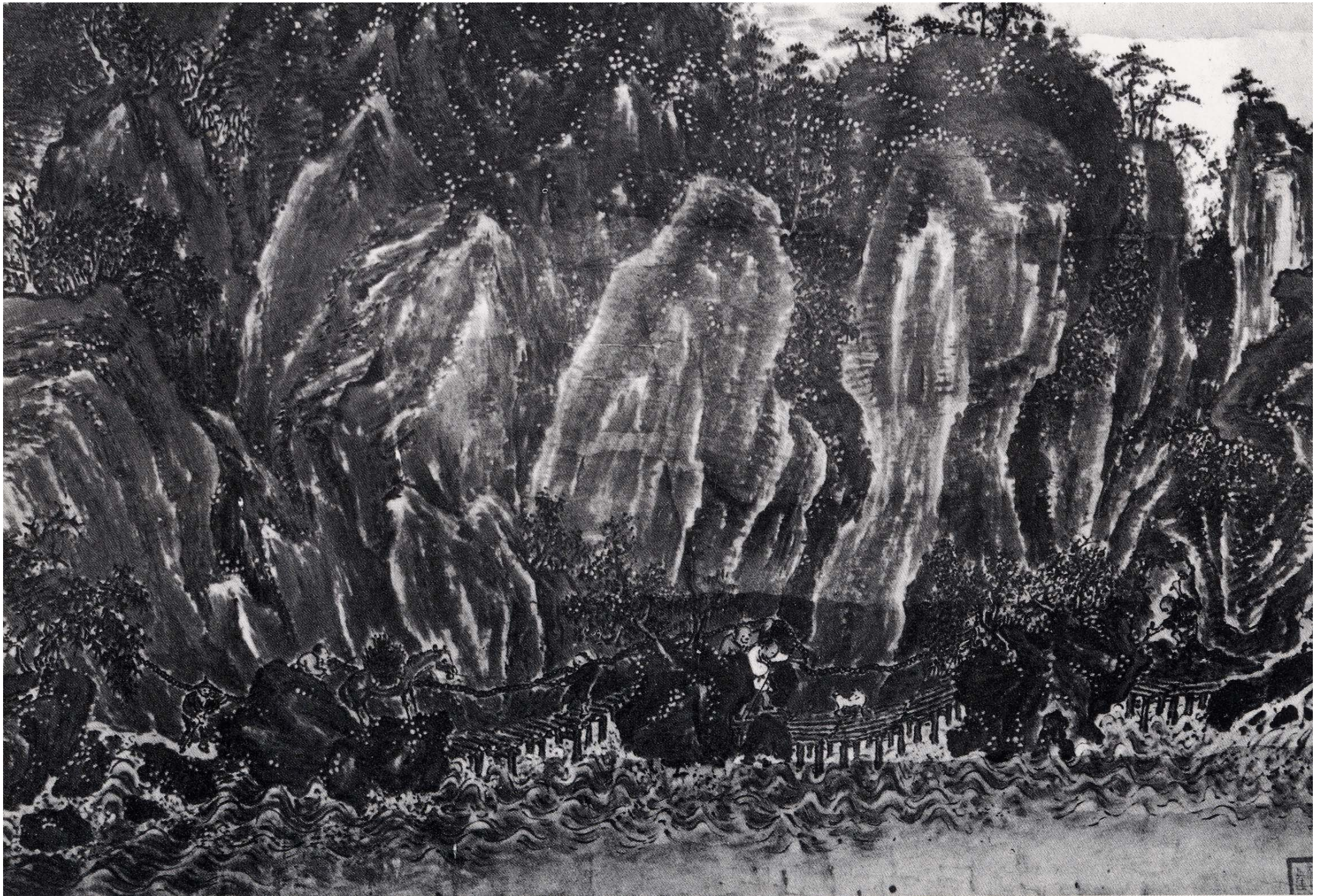
長谷川竹崖画『鎖戸の図』（巖水園発行絵葉書より引用）