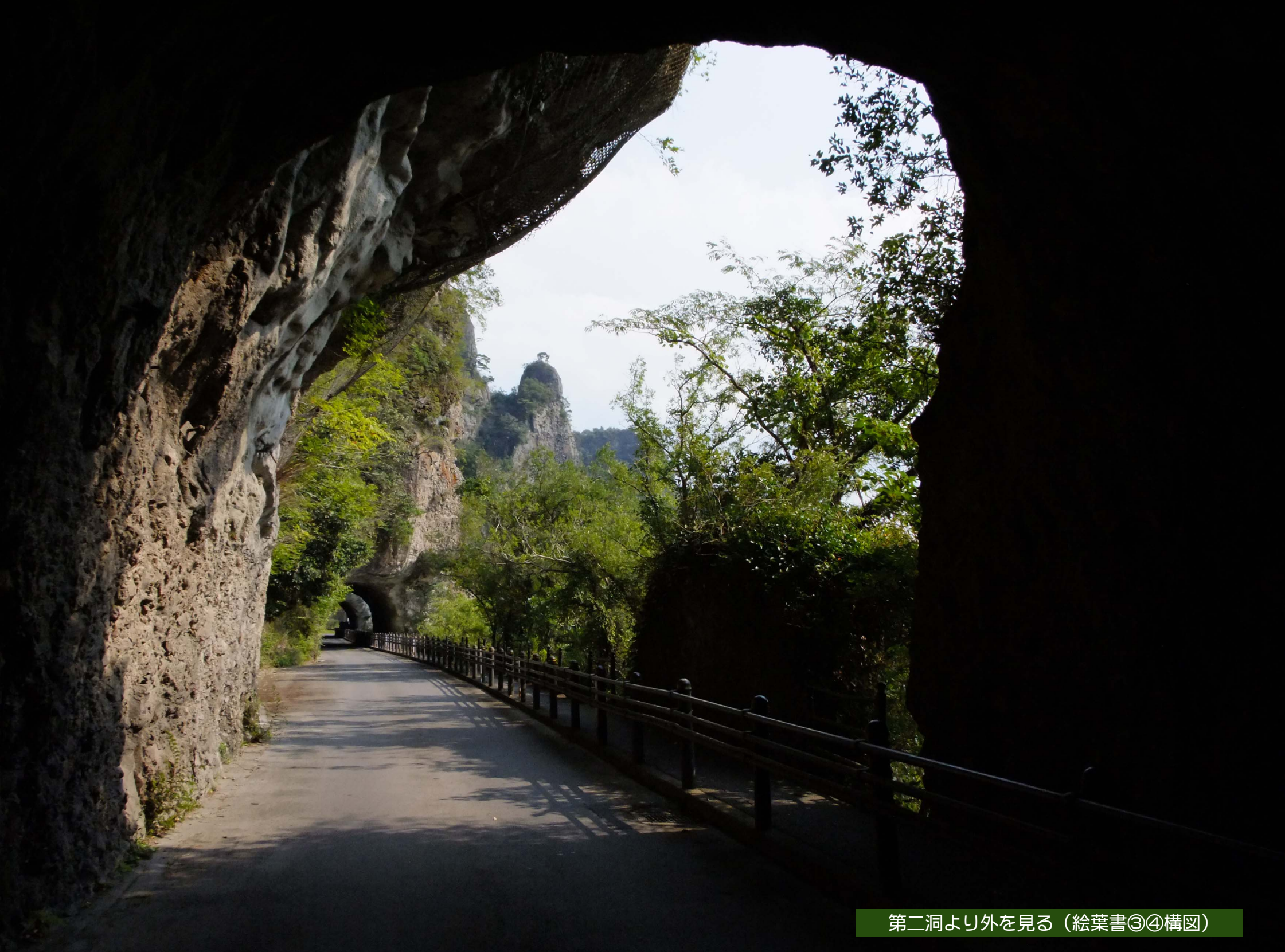
第二洞より外を見る（絵葉書③④構図）