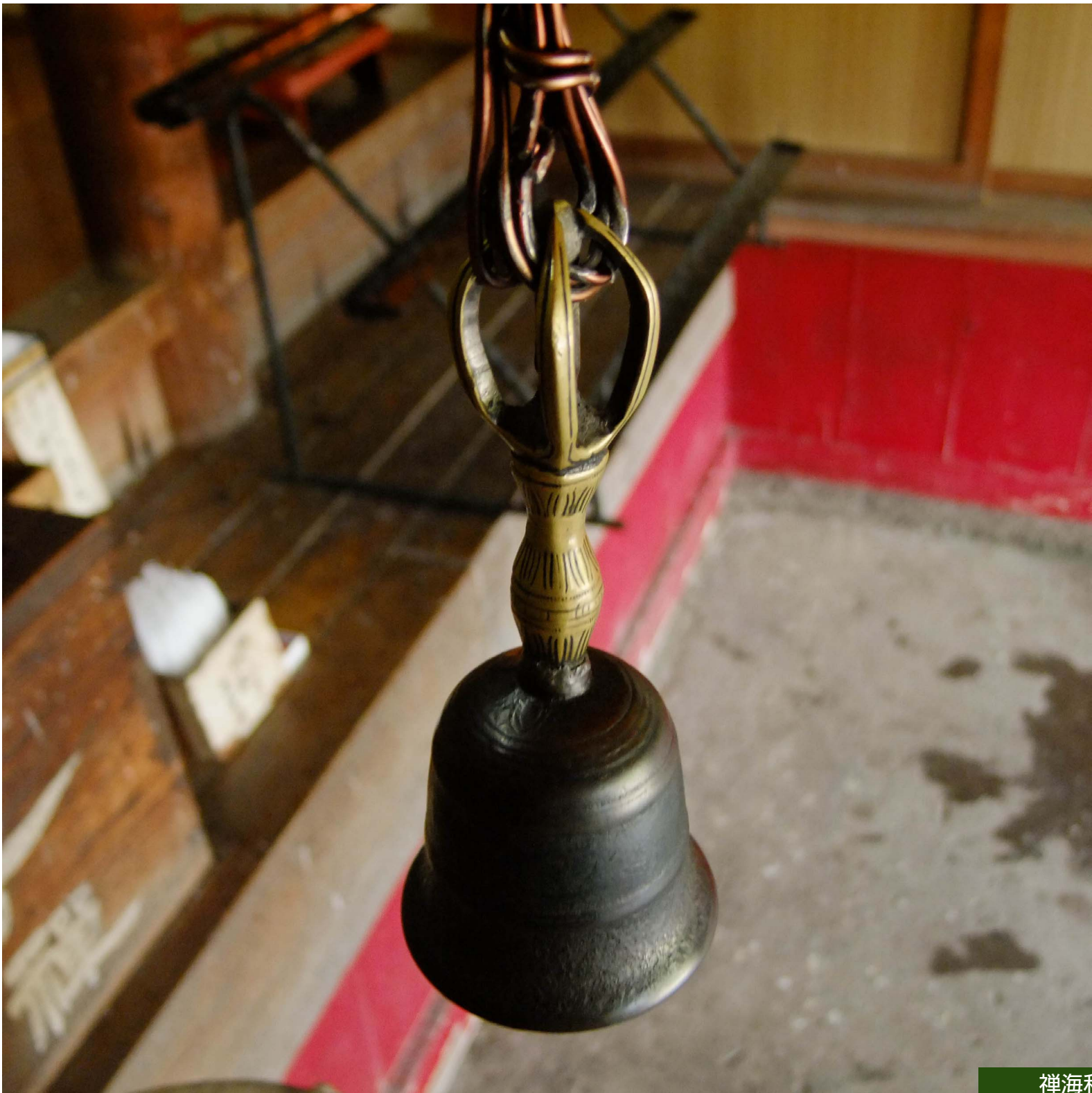
禅海和尚使用の鈴