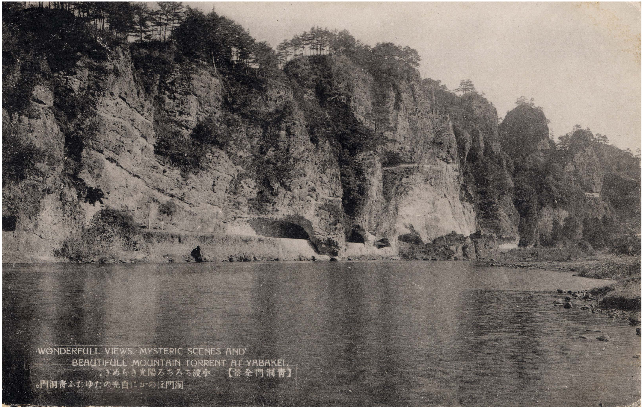
WONDERFULL VIEWS, MYSTERIC SCENES AND BEAUTIFULL MOUNTAIN TORRENT AT YABAKEI. 。きめらき光陽ろちろち波小 【景全門洞青】 。門洞青ふたゆたの光白にかのほ門洞