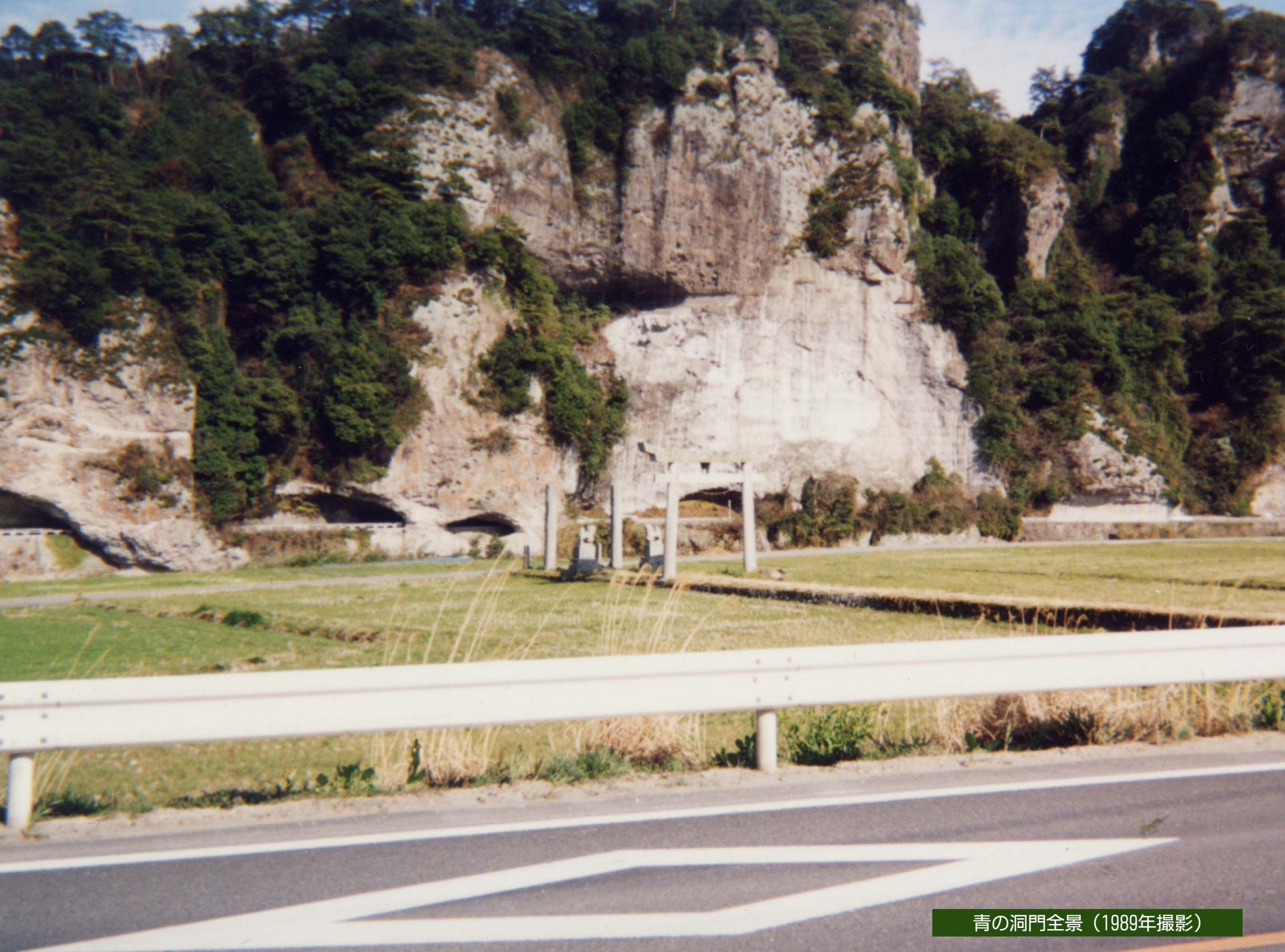
青の洞門全景 (1989年撮影)