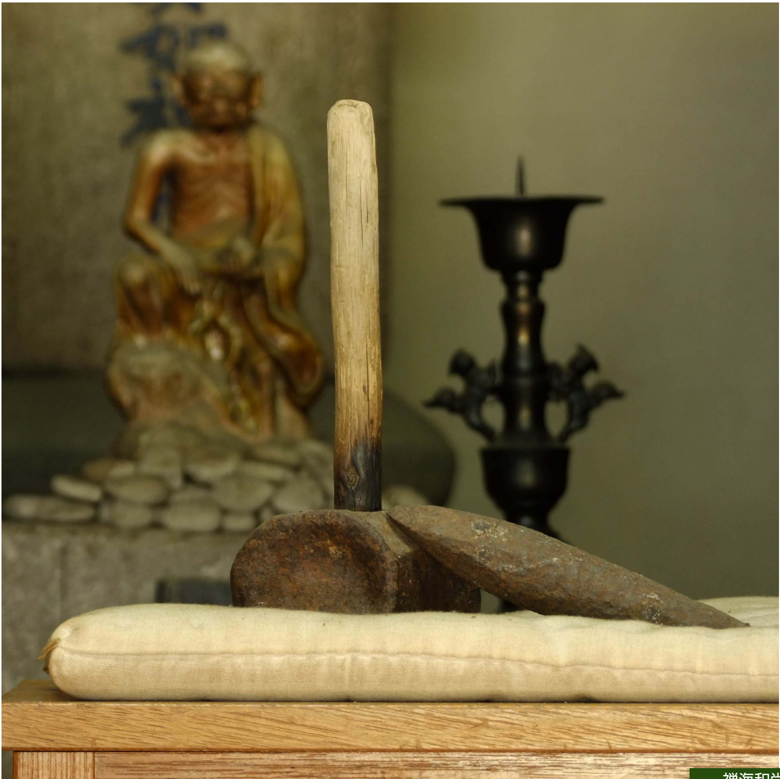
禅海和尚使用の鑿と鋤