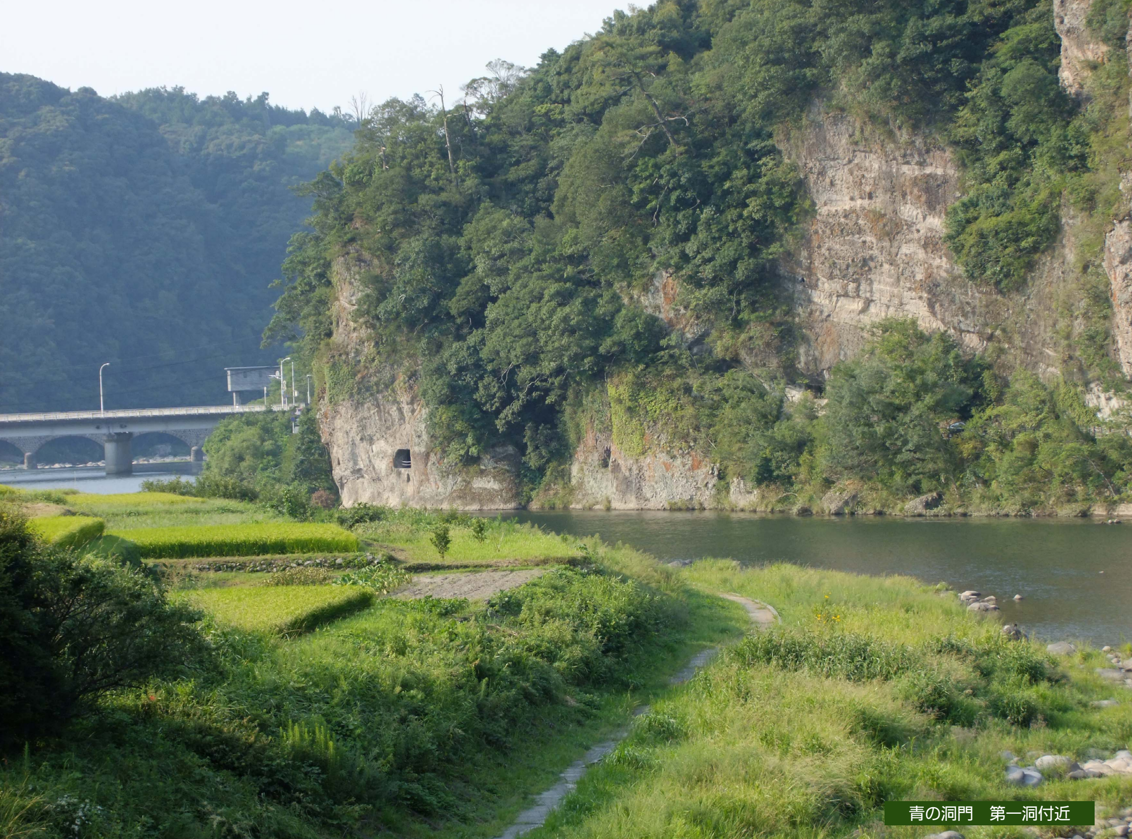
青の洞門 第一洞付近